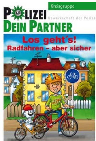
Radfahren - aber sicher für Schulkinder

Im Straßenverkehr sind besonders die Kinder gefährdet. Richtiges Verhalten wird mit diesen Heften „spielend“ vermittelt.